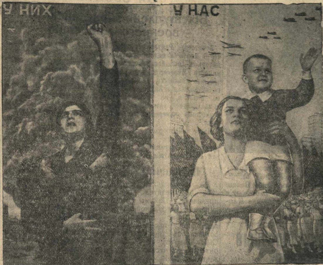
Плакаты «У них и у нас» — работы художника В. Корецкого, выпущенный издательством «Искусство» к Международному коммунистическому женскому дню.