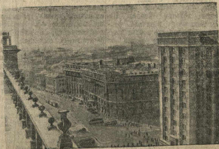
Вид на Манежную площадь. Справа Дом СНК СССР.