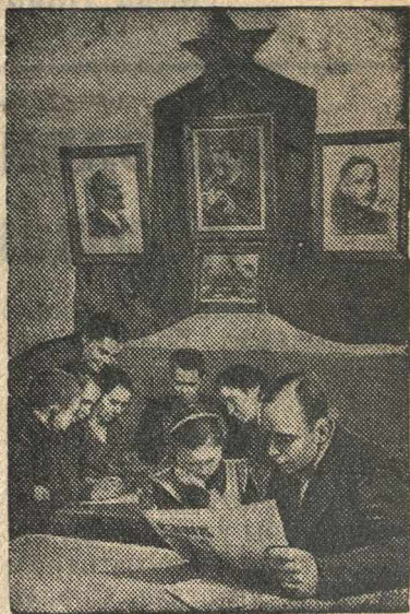
В красном уголке.

Домовый комитет дома № 12 по ул. Яна Асара в г. Риге организовал Красный уголок, где жильцы дома проводят свои свободные вечера.