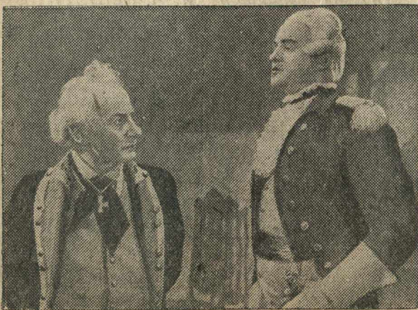
Кадр из фильма „Суворов“