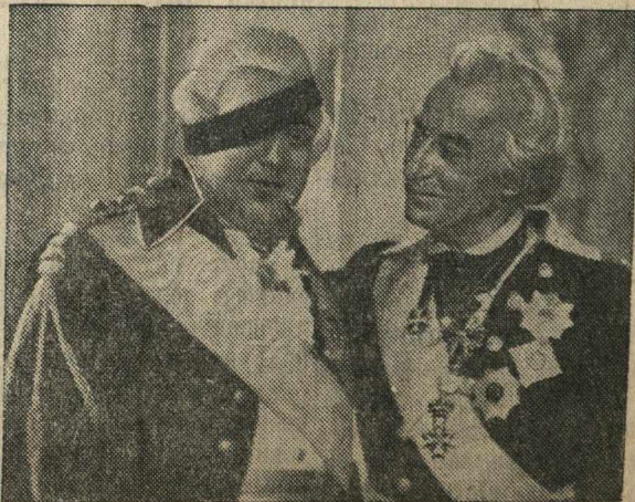
Кадр из фильма „Суворов“