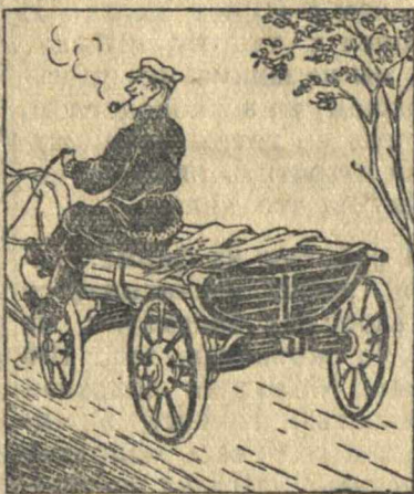
Сел да поехал, —ах хорошо!