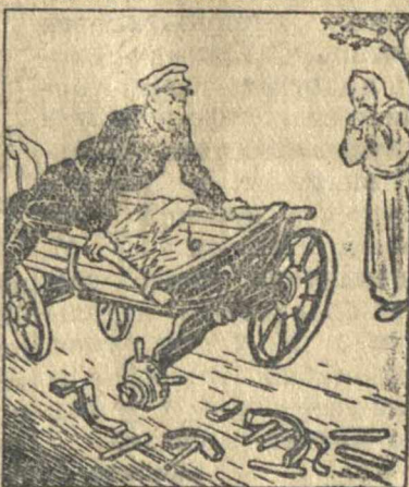
Оглянулся назад— одни спицы лежат! (Пословица)