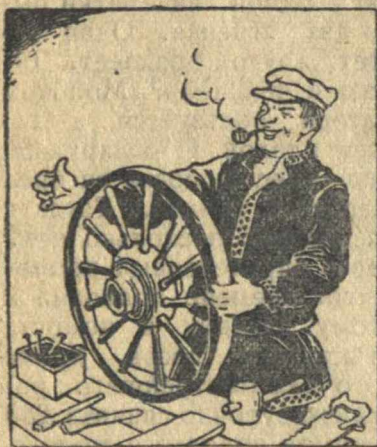
„Сбил, сколотил— вот колесо!“

В панкратовском колхозе «1-е августа» плохо готовят к севу сельскохозяйственный инвентарь. Особенно плохо колхоз обеспечен телегами. В бригадах, имеющих по 15—20 рабочих лошадей, с трудом можно найти 3—5 кое-каких телег. Приближается весенний сев, но ремонт телег и колес предколхоза т. Таратынов все еще откладывает.