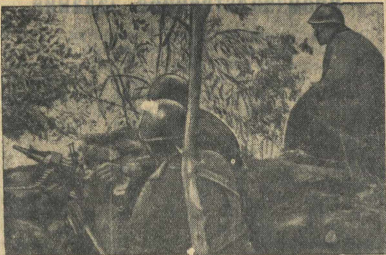
Итальянская огневая пулеметная позиция на греко-албанском фронте.