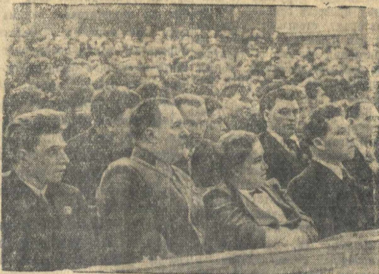
Четвертая сессия Верховного Совета РСФСР 1-го созыва. В зале заседаний.

Нет сомнения, что коммунисты на отчетно-выборных собраниях изберут в партийные органы людей беззаветно преданных делу партии Ленина — Сталина, умеющих в работе опираться на массы, по-большевистски воспитывать массы и возглавлять их политическую, хозяйственную активность.