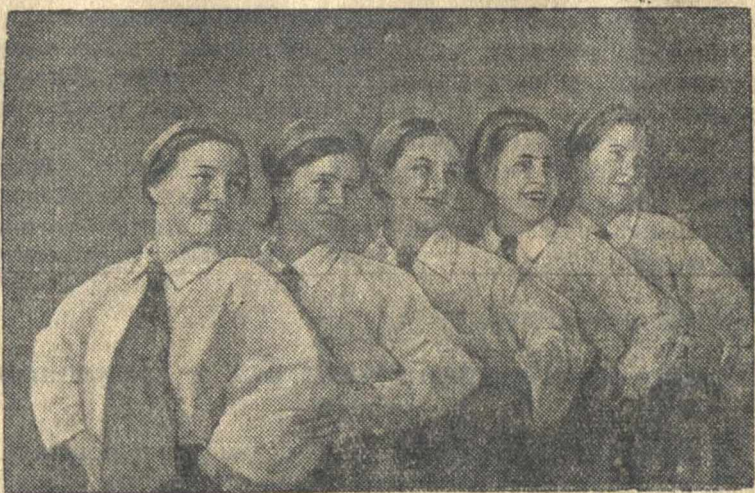
Экцентрический танец в исполнении балетного коллектива.