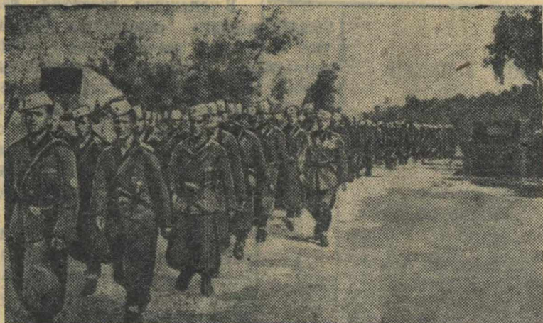
Итальянские войска в Албании.