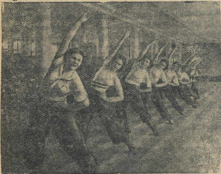
Группа девушек-комсомолок автозавода имени Сталина (Москва) выполняет гимнастические упражнения из комплекса ГТО.