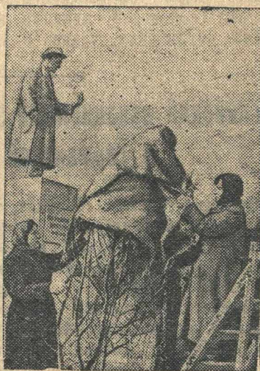
Снимают утепления с яблонь в Мичуринском саду.

С наступлением теплых дней на ВСХВ начали освобождать деревья от зимних утепленных укрытий.