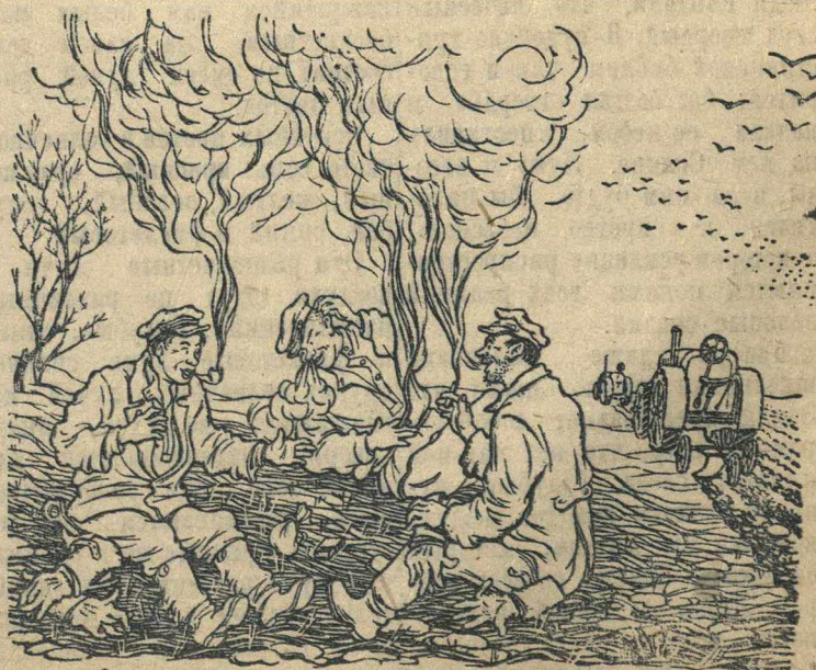
Много дыму, да мало пыли.