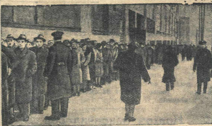
В ожидании работы в Нью-Йорке.