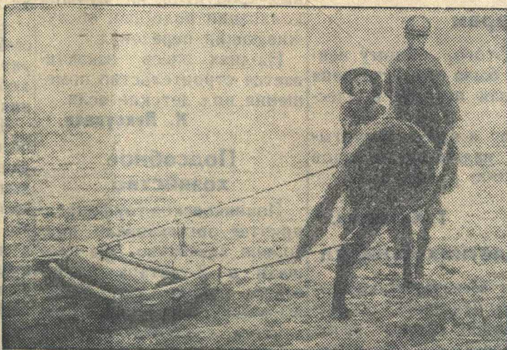
Манчжурский крестьянин на весенних полевых работах.

Печать, типография „КД“ МЦ-14557 тираж 5000 экз.