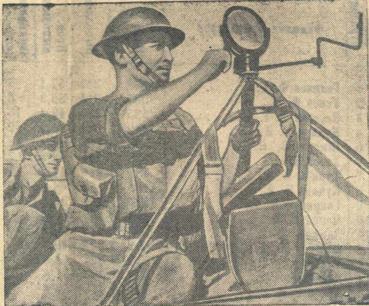
Занятия английских солдат с гелиографом (прибором, служащим для сигнализации).