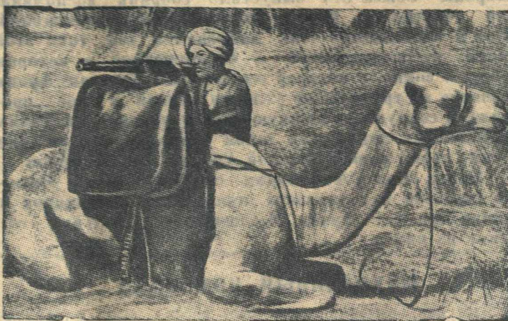
Верблюжий дозор суданских войск на эритрейской границе.