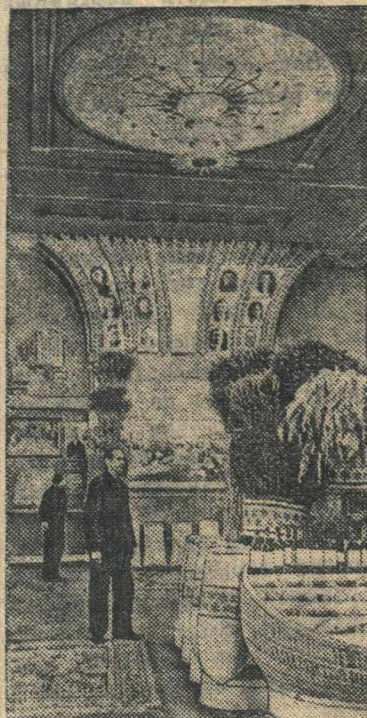
В павильоне „Сибирь“. Справа — стенд Челябинской плодовоовощной станции имени Мичурина.

Всесоюзная сельскохозяйственная выставка.