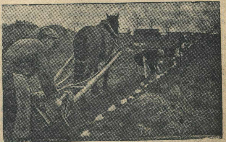
Посадка семенной капусты в колхозе им. Ильича (Кунцевский район, Московской области).