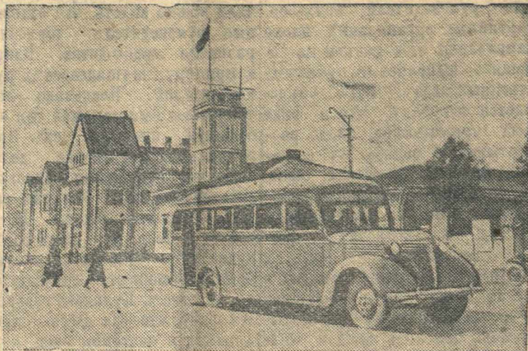
Автобус на пути в рабочий поселок Хелюля.

В новом советском городе Сортавала (Карело-Финская ССР) открыто регулярное движение пригородных пассажирских автобусов.