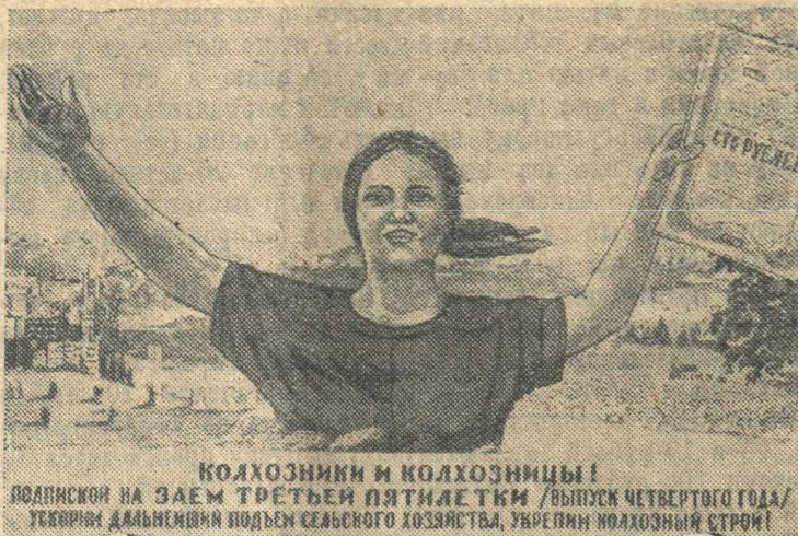
КОЛХОЗНИКИ И КОЛХОЗНИЦЫ! ПОДПИСКОЙ НА ЗАЕМ ТРЕТЬЕЙ ПЯТИЛЕТКИ (ВЫПУСК ЧЕТВЕРТОГО ГОДА) УКРЕПИМ ДАЛЬНЕЙШИЙ ПОДЪЕМ СЕЛЬСКОГО ХОЗЯЙСТВА, УКРЕПИМ КОЛХОЗНЫЙ СТРОИТЕЛЬСТВО!