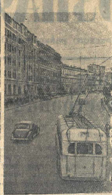
Киев. Крещатик.