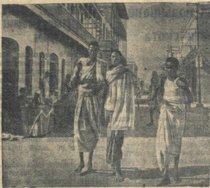
Улица в Джибути (Французское Сомали).