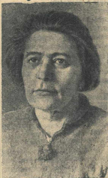
Анна Паукер — одна из активных деятелей рабочего движения в Румынии, долгое время находившаяся в заключении. В результате переговоров между правительствами СССР и Румынии тов. Паукер освобождена из тюрьмы. Она приехала в СССР и находится в Москве.

Ни одного сорняка в культурных растениях! Взять от земли все, что она может дать, перевыполнить государственный план урожайности! В этом направлении должны работать сейчас все колхозные руководители и колхозники.