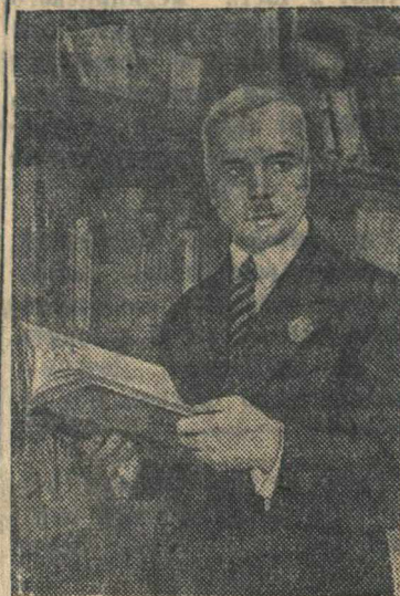
Таджикский поэт и драматург дважды орденносец А. Лахути в своем кабинете