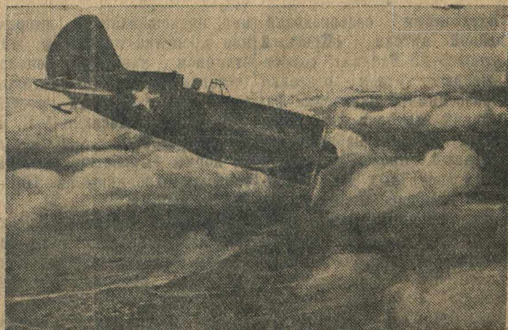
Истребитель в разведке.