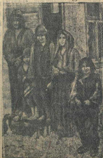
Доведенная до крайней нищеты румынская семья.

Починки, типография «БД» МП-14605 тираж 5000 экз.