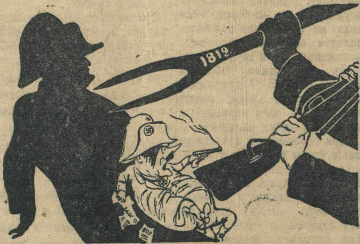
Наполеон потерпел поражение, то же будет с зазнавшимися Гитлером!

Рисунок худ. Кокрыныксы (Репродукция с плаката, выпущенного издательством „Искусство“).