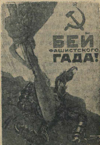
Рисунок художника Кокорекина (Репродукция с плаката, выпущенного издательством «Искусство»).