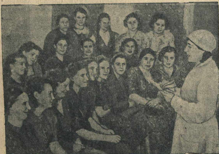
Будущие доноры в зале регистрации, перед медицинским обследованием.

Каждый день в Институт переливания крови (Москва) являются работницы, домохозяйки, учащиеся и жены мобилизованных в Красную Армию с просьбой записать их в доноры.