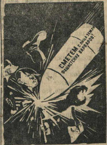
Рисунок художника Н. Долгорукова. (Репродукция с плаката, выпущенного издательством «Искусство»).