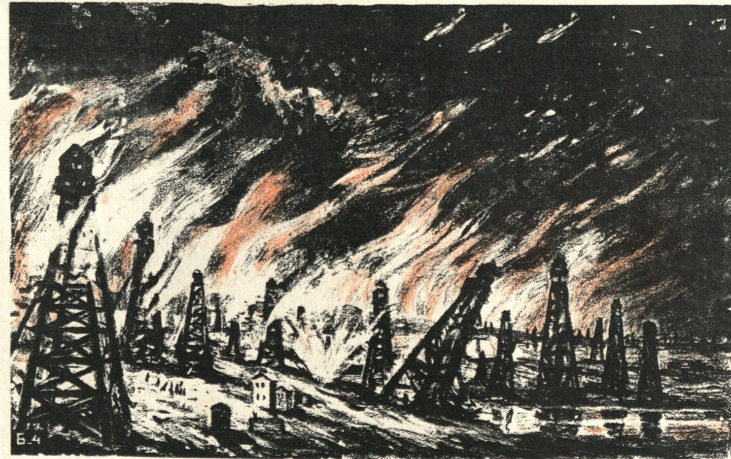
Рис. худ. М. Полякова, Б. Рыбенкова, А. Суворова.

Зарево пожаров полыхает над Плоешти — нефтеносным районом Румынии, откуда германское командование черпает горючее для своих танков и авиации. Чуть только спускается темная, южная ночь, красноезвездные самолеты бомбят промысла, разрушают вышки, закигают нефтехранилища и невредимыми возвращаются на свои базы.