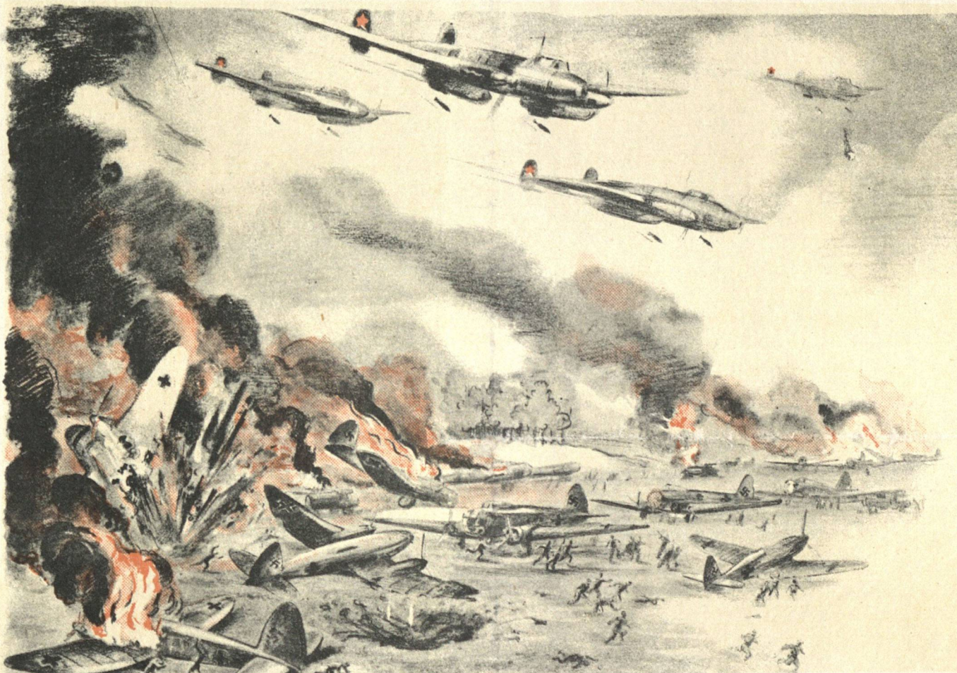
Рис. худ. П. Кирпичева.

Разведка обнаружила в 20 километрах от фронта у города Б. полевой аэродром противника; на летном поле находилось около 30 машин. Тотчас же с трех направлений туда устремились наши истребители и бомбардировщики. Никто на фашистском аэродроме не успел опомниться, как в разных концах поля взметнулись языки пламени. Вспыхнули „Юнкерсы“, „Хейнкелы“, „Мессершмитты“. Заметались внизу люди, но пулеметный огонь настигал их повсюду.