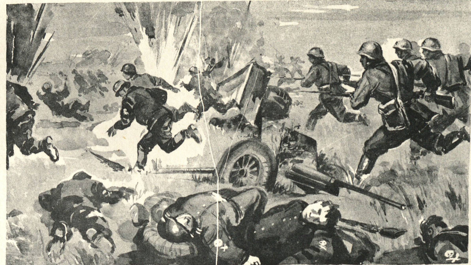
Рис. худ. А. Бубнова.

Эмблему смерти — череп со скрещенными костями — носили солдаты особой фашистской дивизии, брошенной германским командованием на Восточный фронт. Фашисты, все поголовно пьяные, ринулись в стремительную атаку, но не выдержав сосредоточенного огня артиллерии, авиации и пулеметов, дрогнули и откатились назад. Мощный штыковой удар красноармейцев закончил разгром гитлеровской гвардии. Тысячи оставшихся на поле боя фашистов были также мертвы, как и украшающая их маскарадная эмблема.