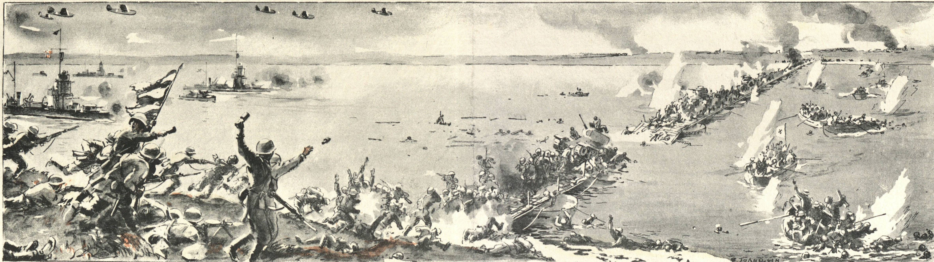
Рис. худ. В. Голицына.

Немецкое командование несколько раз пыталось организовать переправу через реку в 15 километрах от города Д., но каждый раз неудачно. Не успели фашистские танки и мотоциклы вступить на pontонный мост, как из-за поворота реки показались советские мониторы и катеры. Метким огнем они разрушили мост, сбросили в реку 9 танков, несколько десятков мотоциклов и потопили 20 лодок с пехотой солдат и офицеров. Уцелевшие лодки были уничтожены у нашего берега подоспевшими частями мотопехоты.