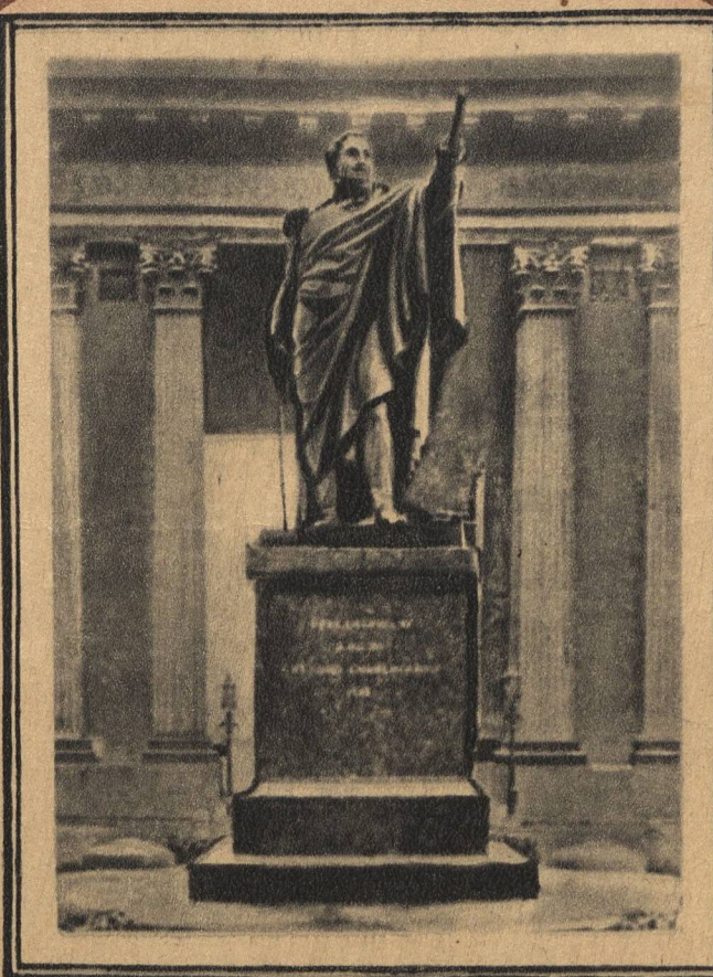
ПАМЯТНИК М. И. КУТУЗОВУ В ЛЕНИНГРАДЕ