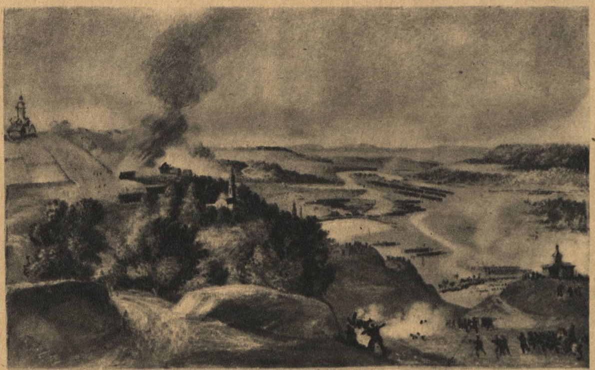
БОЙ ПОД МАЛОЯРОСЛАВЦЕМ

«На такой штурм можно решиться только раз в жизни», — говорил после победы Суворов, а о Кутузове написал в своем донесении: «Он шел на моем левом крыле, но был моей правой рукой».