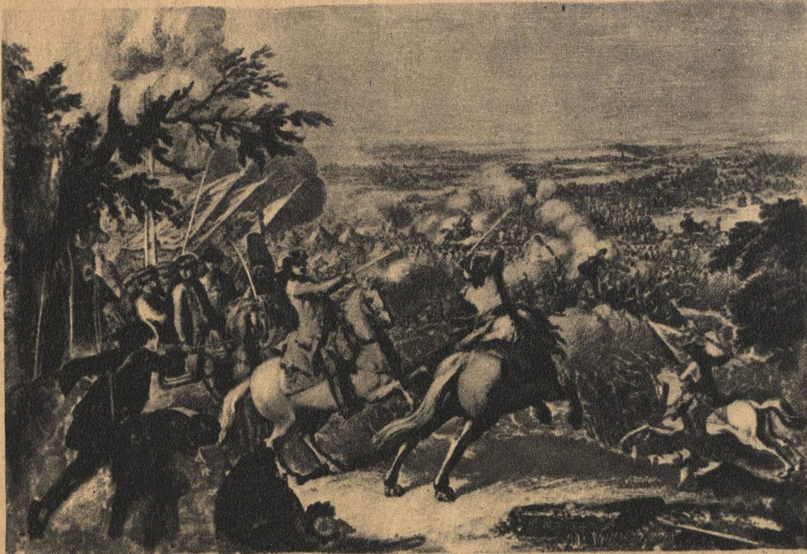
СРАЖЕНИЕ ПРИ КАГУЛЕ