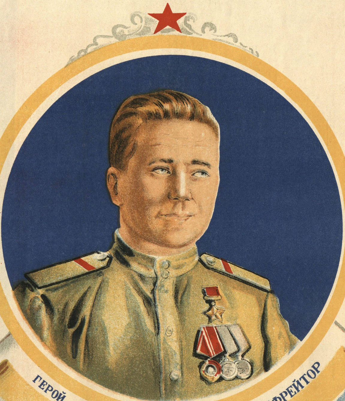
ГЕРОЙ СОВЕТСКОГО СОЮЗА РАДИСТ ЕФРЕЙТОР И. КОЛОДИЙ