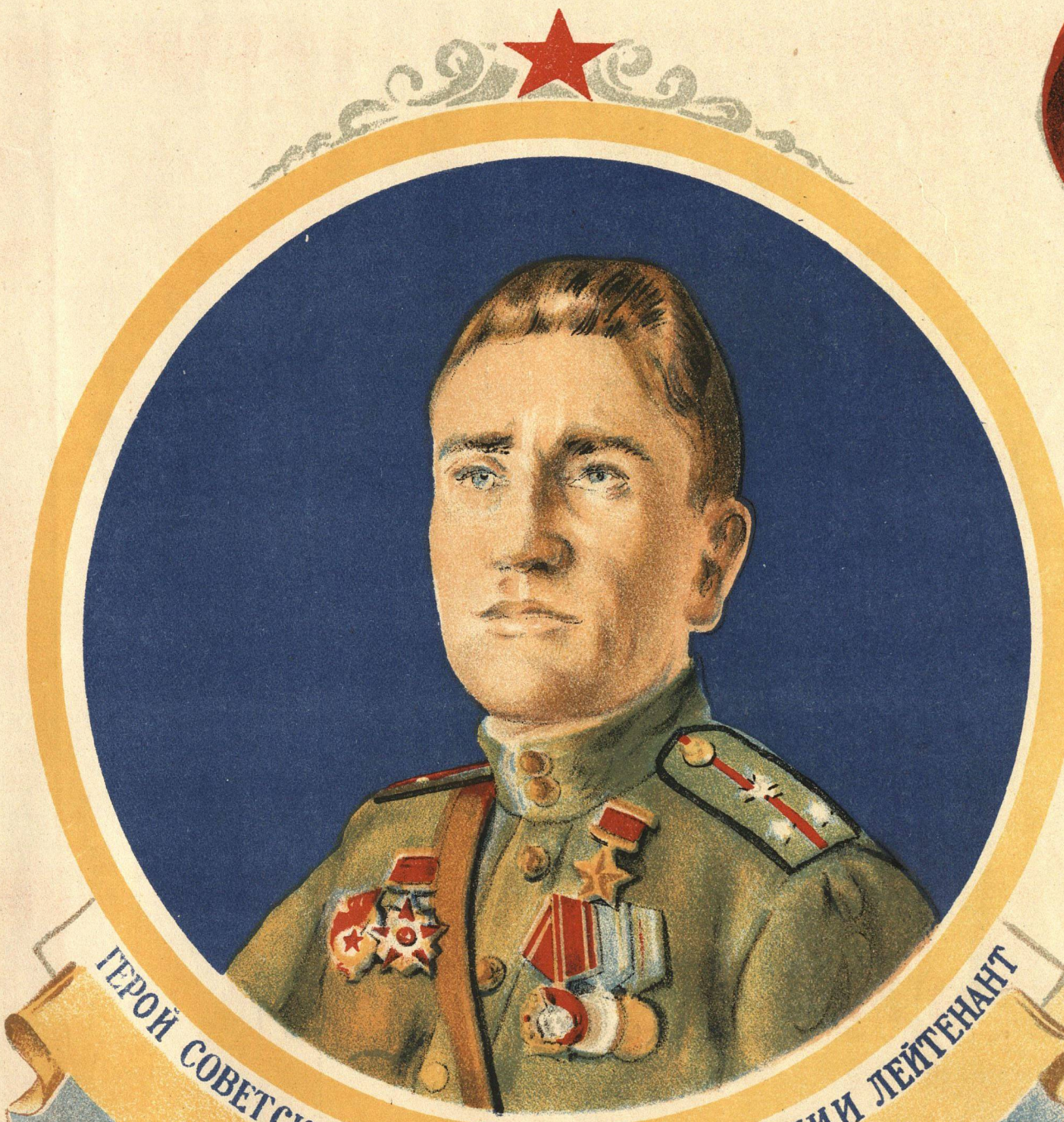
ГЕРОЙ СОВЕТСКОГО СОЮЗА СВЯЗИСТ ГВАРДИИ ЛЕЙТЕНАНТ Б. СКИТЫБА

Тов. Колодию присвоено звание Героя Советского Союза. Его автомат и радию хранят в Музее связи в Москве.