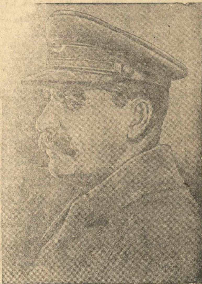
Верховный Главнокомандующий Иосиф Виссарионович СТАЛИН