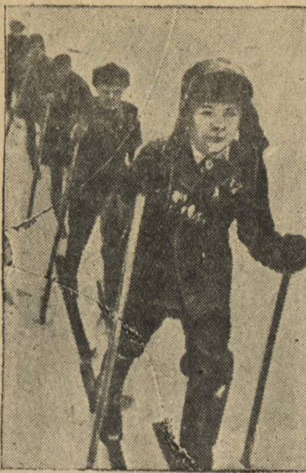
Ученики школы № 27 на лыжной вылазке.

По сообщению корреспондента агентства Ассошиэтед Пресс из г. Панамы, новая конституция Панамы, вступившая в силу со вчерашнего дня, лишает панамского гражданства около 80 тысяч негров, родившихся на принадлежавших Англии островах Вест-Индии, что составляет 12 проц. населения. Согласно новой конституции, гражданства лишаются также все родившиеся после 1903 года представители азиатских народностей. (ТАСС).