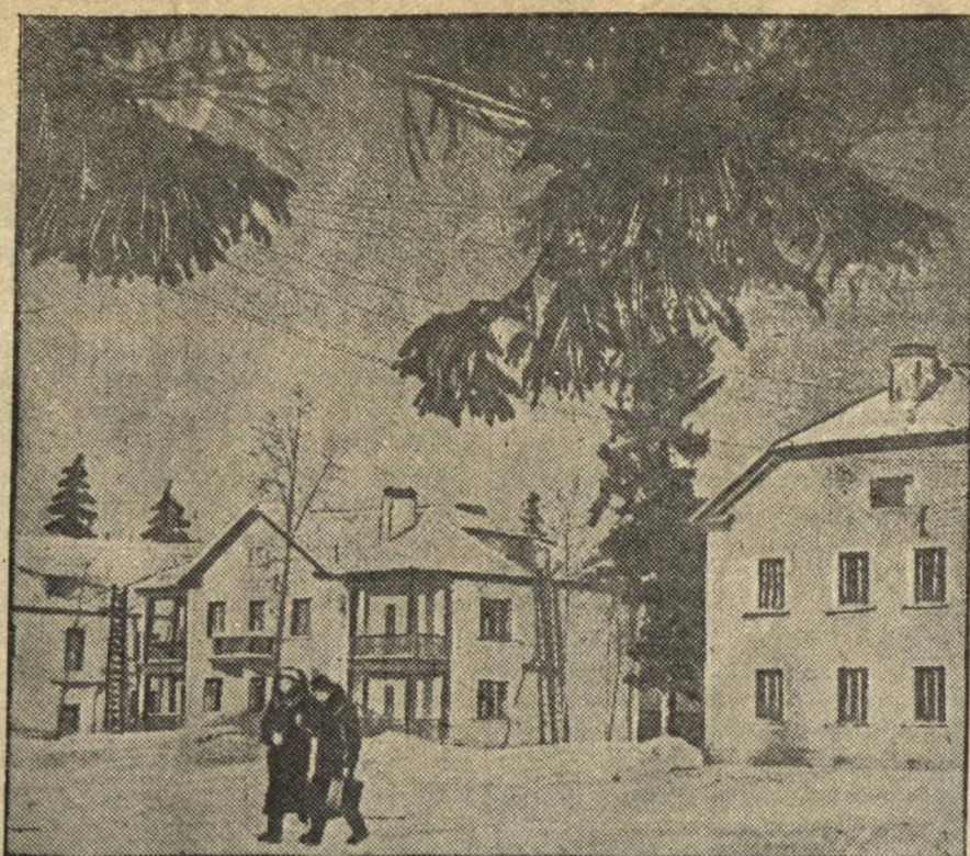
С фотоаппаратом по району. На улице Культурной поселка Строителей.