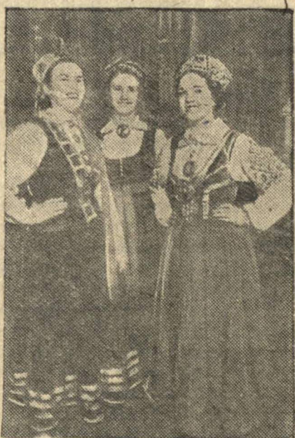
НА СНИМКЕ: участники художественного коллектива народной песни и пляски в гор. Риге, успешно выступавшего в дни недавно закончившейся изобразительной кампании.