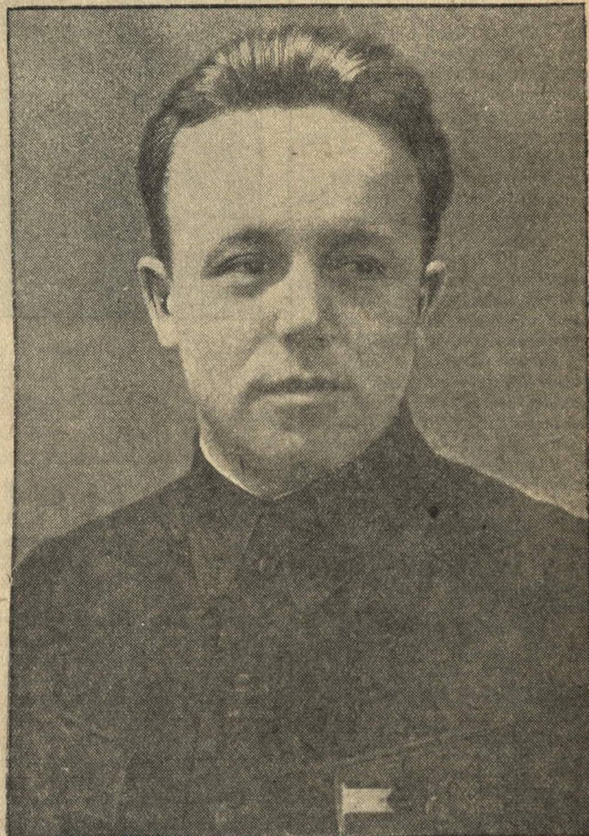
МИХАИЛ ИВАНОВИЧ РОДИОНОВ, секретарь Горьковского обкома и горкома ВКП(б) — кандидат в депутаты Совета Союза Верховного Совета СССР от Горьковского-Ленинского избирательного округа № 116.