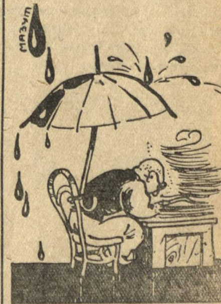
МЕХАНИК: «Над нами не каплет». Рис. А. БРУСИНА.

Е. КУРАТОВ, кузнец мастерской кованых машин.