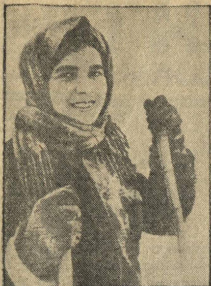
НА СНИМКЕ: копировщица автоцеха ГОЛОВА на лыжах.

Н. С. БЕЛЯЕВ, преподаватель средней школы взрослых № 13.