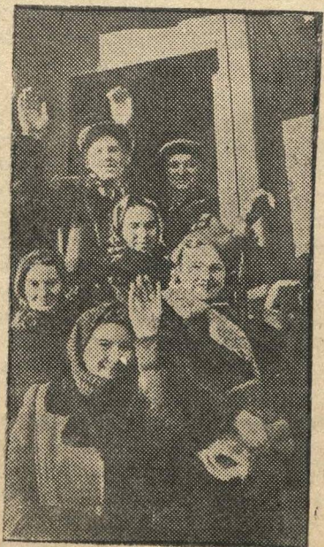
В Советской Литве. НА СНИМКЕ: работницы и рабочие города Каунаса, уезжающие в дома отдыха на Кавказ.

Несмотря на дождливую погоду и грязную дорогу, 450 команд юношей и девушек Ташкента приняли участие в переходах по пересеченной местности.