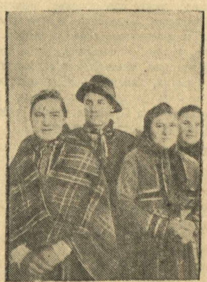
В Советской Латвии. НА СНИМКЕ: певцы Гуденекской волости в народных костюмах.