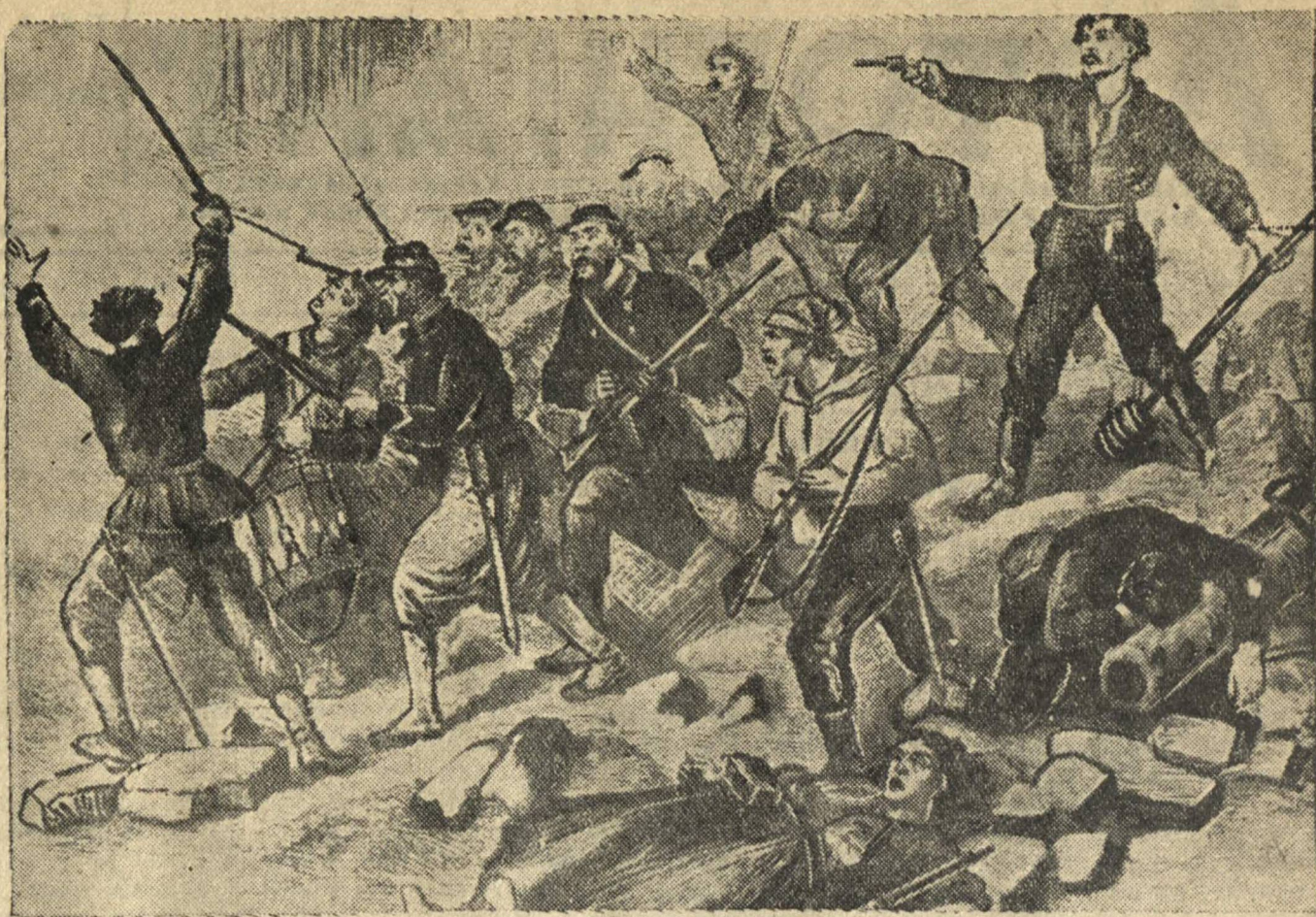
Парижская Коммуна. НА СНИМКЕ: В последний бой. (1871 г.).

еще упорнее воспитывать массы в духе международной пролетарской солидарности; еще выше и крепче держать знамя пролетарского интернационализма, живым воплощением которого является непобедимый советский патриотизм; неустанно спланировать ряды борцов трудящихся всех стран за полную победу бессмертного дела Парижской Коммуны, великого дела Маркса—Энгельса—Ленина—Сталина во всем мире.