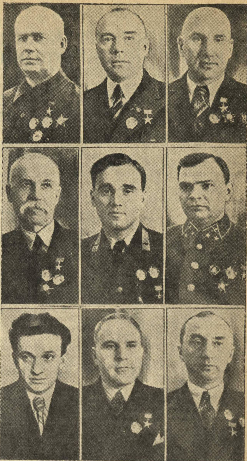
Новаторы социалистической техники. Выдающиеся конструкторы и изобретатели, которым присуждены Сталинские премии первой степени. Слева направо: в первом ряду — Герои Социалистического Труда В. А. ДЕГТЯРЕВ, А. А. МИКУНИН. Во втором ряду — Герои Социалистического Труда Ф. В. ТОКАРЕВ, А. С. ЯКОВЛЕВ, В. Г. ГРАБИН. В третьем ряду — А. И. МИКОЯН, Герои Социалистического Труда Б. Г. ШПИТАЛЬНЫЙ и В. Я. КЛИМОВ.