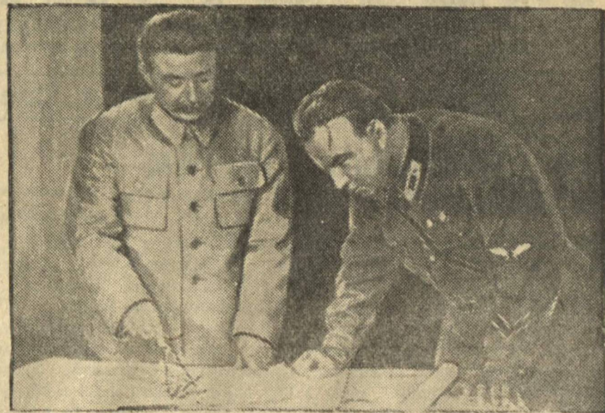
Кадр из фильма В. П. Чкалов.