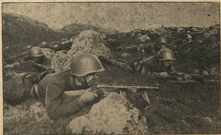
НА СНИМКЕ: краснофлотцы на пер едовой линии фронта.

Это сообщение германского информационного бюро является гнусной ложью. Оно свидетельствует о том, что немцы, подготавливая в широких масштабах бомбардировку невоенных объектов Ленинграда, стремятся заранее снять с себя ответственность за подобные варварские действия. Однако, этот жульнический маневр не введет никого в заблуждение. Весь мир прекрасно знает, что гитлеровские мерзавцы способны лишь на самые потные дела.