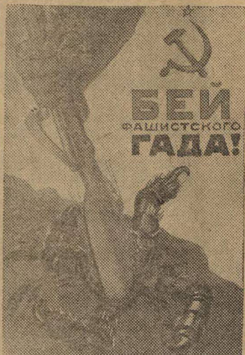
Рисунок художника Кокорекина (Репродукция с плаката, выпущенного издательством «Искусство»).