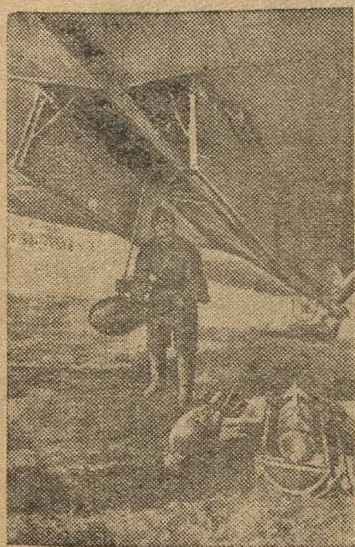
Перед боевым вылетом.