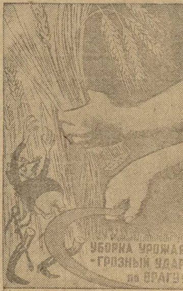
Рисунок худ. Кукрыникисы.