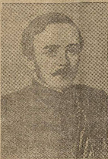
Михаил Юрьевич Лермонтов.

К 100-летию со дня смерти М. Ю. Лермонтова (27 июля 1941 г.).