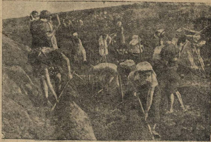
В прифронтовой полосе.