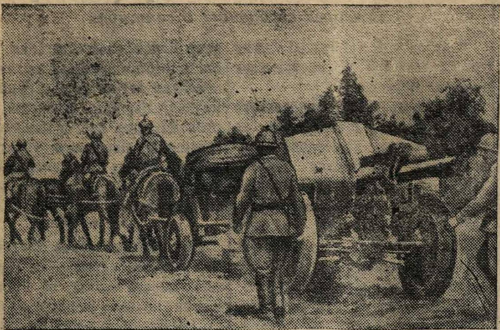
Советские артиллеристы продвигаются на передовые позиции.