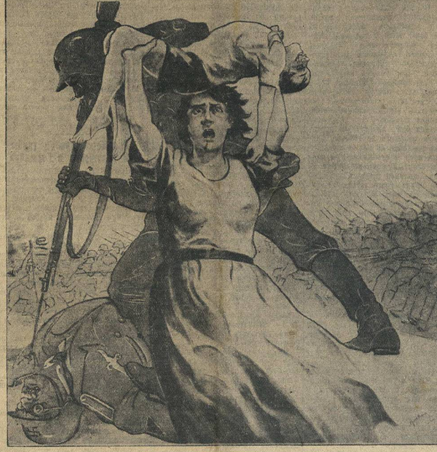
Планат худ. Марин Мазин.