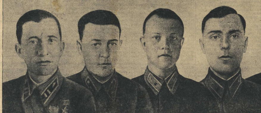
Герои Великой Отечественной войны. На снимке: группа командиров Красной Армии, которым за образцовое выполнение боевых заданий Командования на фронте...

В течение 21 сентября наша война велась с противником на всем фронте. После многодневных ожесточенных боев наши войска оставили Киев.