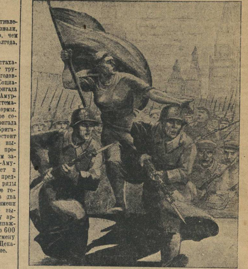
Планет М. Марин.

«Вот несколько выдержек из дневника командира отряда. В течение 4 ноября наши войска вели бой с противником на всех фронтах.