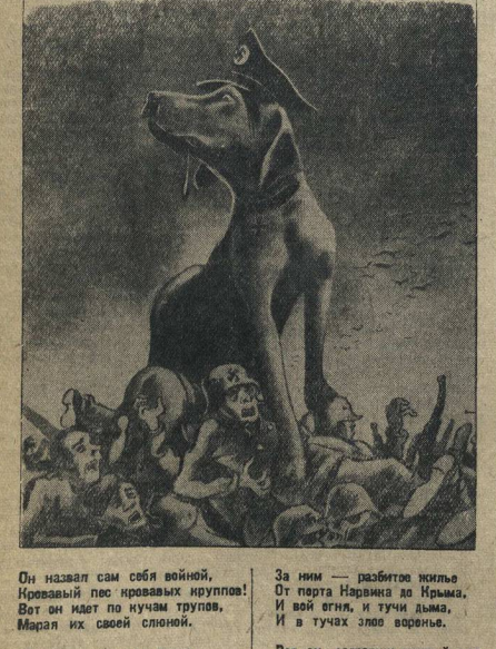
Он назвал сам себя войной, Ивовый лес кровавых крупин! Вот он идет по кучам трупов, Марал их своей слюной.

Молтах П. Голованов и А. Капалюша. Текст М. Шестеркова.