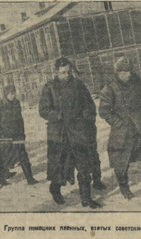
Советские воины при занятии местечка Н.

На Испания—не только страна пылкого гонимого и безработицы. Это также страна террора и подневельства.