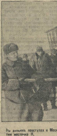
На дальних подступах к Москве. Группа немцев пленных, взятых советскими войсками при занятии местечка Н.

Издательство Горьковского областного издательства просит читателей проявить интерес к этим книгам и брошюрам. Они будут выпущены в ограниченных тиражах.